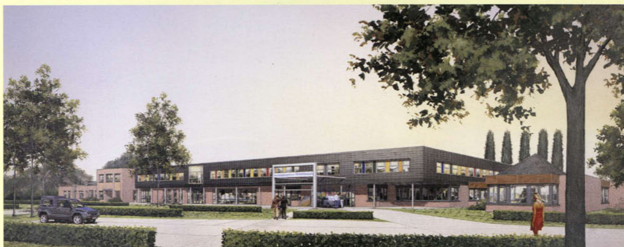
Artist impression Revalidatiecentrum Blixembosch

Revalidatiecentrum Blixembosch besloot medio 2000 met multidisciplinaire behandelteams diagnosegericht te gaan werken. Met als doel het verbeteren van de kwaliteit van behandelen door inhoudelijke verdieping en het opbouwen van specifieke expertise. Zo wil Blixembosch het centrum voor specialistische revalidatiezorg van Zuidoost Brabant zijn. Omdat het huidige gebouw op de oude dienstenstructuur gericht is, niet flexibel indeelbaar en de gebruikers zich moeten aanpassen aan het gebouw, kreeg Odeon Architecten in 2002 na architectenselectie opdracht voor nieuwbouw en renovatie. Na onderzoek van de bebouwing en het terrein is een structuurplan opgesteld. Dit plan was aanleiding voor het College Bouw Ziekenhuisvoorzieningen dit project op de prioriteitenlijst te plaatsen. Het motto van de nieuwbouw is het gebouw aan te passen aan beleid en wensen van de gebruikers. In het huidige gebouw is het moeilijk je te oriënteren, daarnaast is er een nijpend tekort aan behandelruimtes. Het hart van het gebouw wordt gesloopt en maakt plaats voor teamkamers van waaruit de diagnoseteams werken. Het hart van de organisatie werkt vanuit het hart van het gebouw. Door het uitgekiend plaatsen van nieuwe in vormgeving afwijkende volumes en het transparanter maken van de kern, zullen de gebruikers zich beter kunnen oriënteren. Het revalidatiecentrum blijft tijdens de bouwwerkzaamheden functioneren dankzij het bouwen in drie fasen. ■