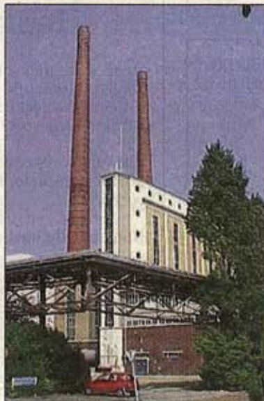
De schoorstenen zijn zo'n 80 m.