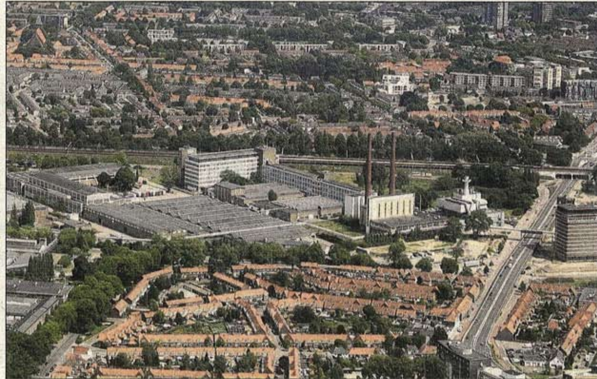
Niet alleen het markante gebouw, maar ook de unieke, centrale plek biedt mogelijkheden voor herontwikkeling.