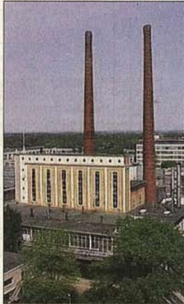
Het ketelhuis van Philips.

Door dat bericht, onlangs in deze krant, besloot Van der Pasch om met zijn plan naar buiten te gaan. Inmiddels ligt het ook bij de gemeente. „Voor een 'designcapital' is er geen plek zo geschikt om alles wat creativiteit en design ademt, naartoe te zuigen”, zegt Van der Pasch. Hij ziet in de plek het ideale ontmoetingspunt voor creatieve functies en kruisbestuiving: centraal gelegen en goed te ontsluiten.